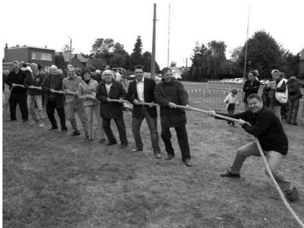
Le Collège communal d'Oupeye