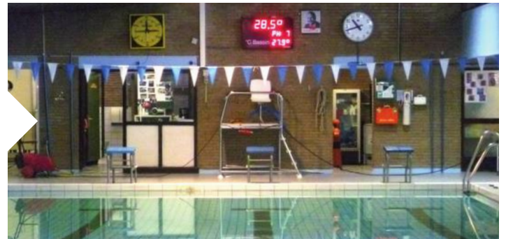
Récemment, la piscine de Haccourt a également été dotée d'un nouvel afficheur.

Nous aurons le plaisir de vous accueillir à nouveau dès le 4 janvier 2018.