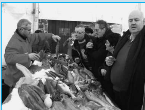
La Coquille Saint-Jacques et le poisson étaient à l'honneur sous le chapiteau situé dans la cour du Château d'Oupeye.