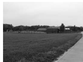
Station d'épuration des eaux usées domestiques