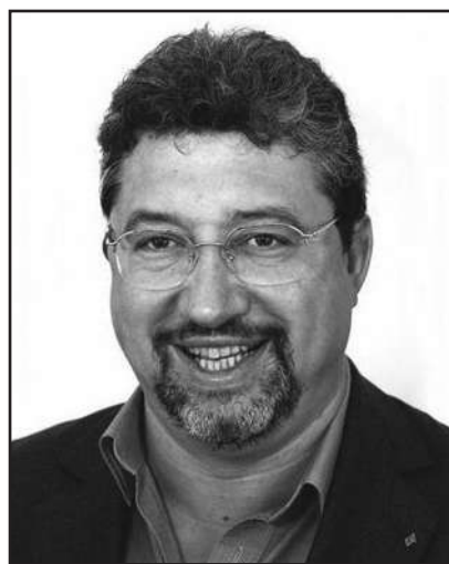
Le Bourgmestre, Mauro LENZINI

C'est dans cette nouvelle dynamique et dans l'espoir de voir ArcelorMittal continuer ses activités dans notre bassin sidérurgique qu'avec optimisme je vous présente, Mesdames, Messieurs, Chers concitoyens, mes meilleurs vœux de bonheur et de santé pour l'année 2008.